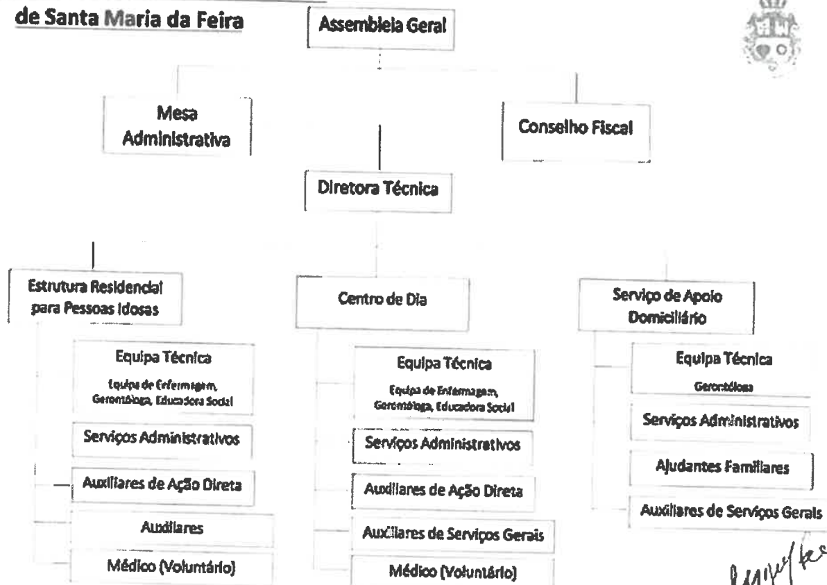
Figura 1- Cronograma Santa Casa da Misericórdia de Santa Maria da Feira